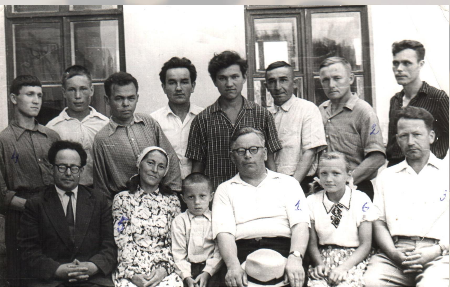
Участники команды Чебоксарского района, занявшей I место в розыгрыше Кубка Чувашской АССР по шашкам. п. Кугеси, 1962 г.