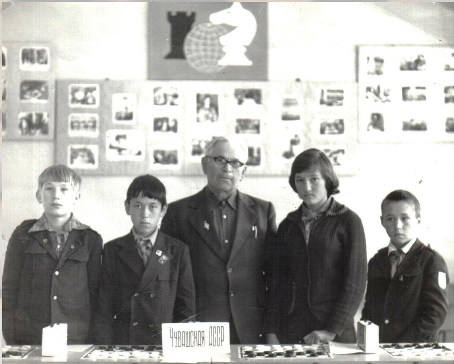
Команда-победительница из Чувашии на первенстве РСФСР среди школьников на приз клуба «Чудо-шашки». г. Магнитогорск, май 1979 г.