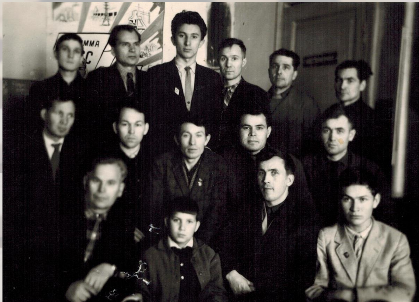
5 первенство Чувашии по стоклеточным шашкам, г. Алатырь