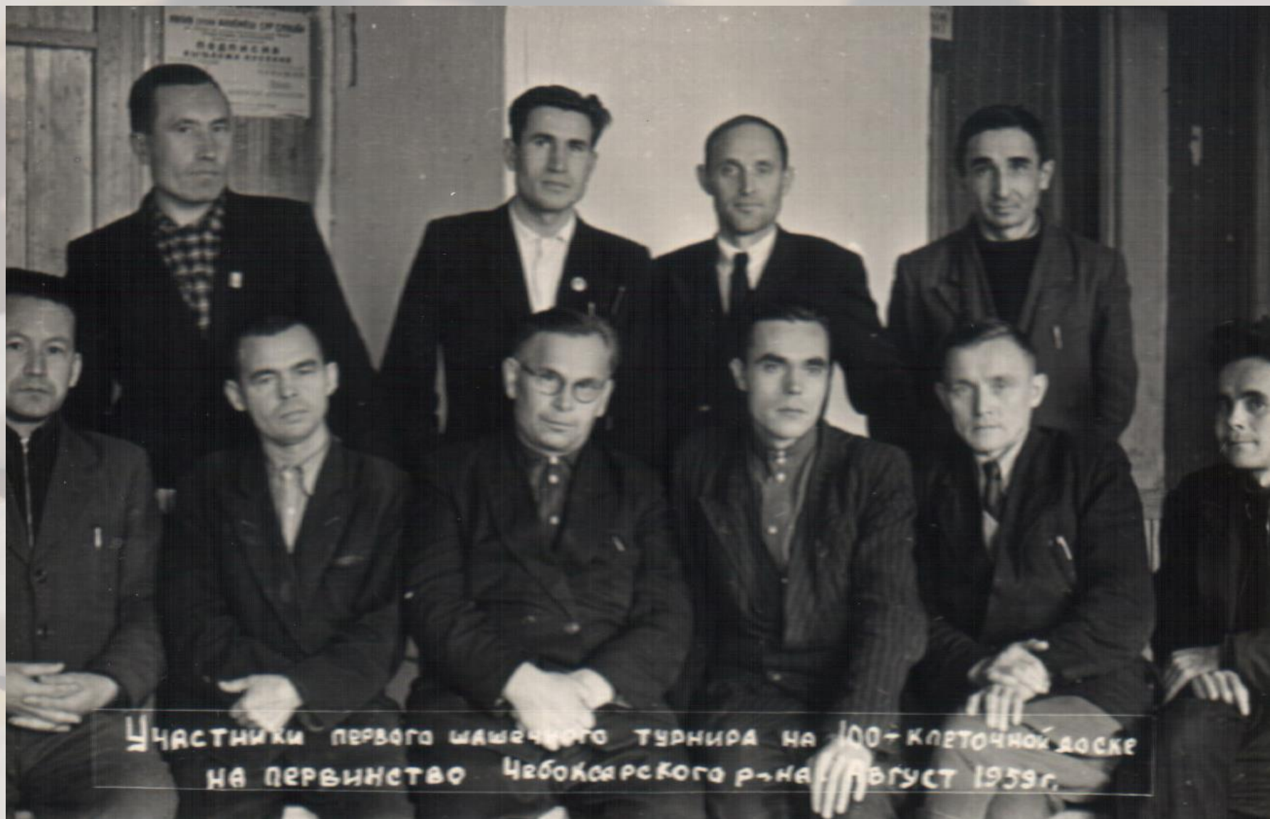
Участники I шашечного турнира по стоклеточным шашкам на первенство Чебоксарского района». 29 августа 1959 г.